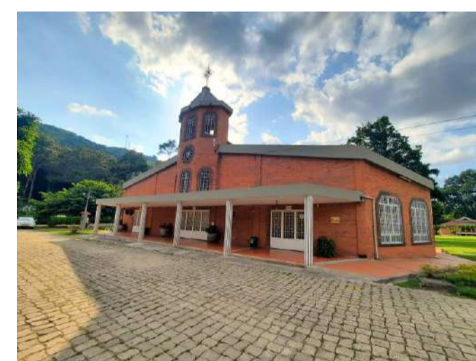
Foyer de Charité

Distribución masiva de los Catálogo- Calendario oficiales.