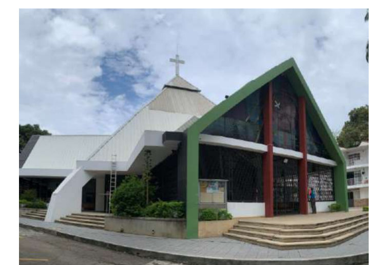
Parroquia Santa María Reina