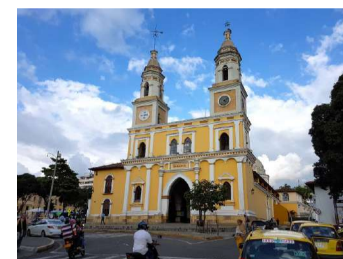
Parroquia San Laureano